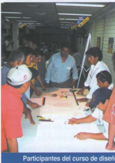
Participantes del curso de diseño discutiendo sus proyectos

EFFECTO: dependerá de nosotros, y de que tipo de forma enfatice-mos más.