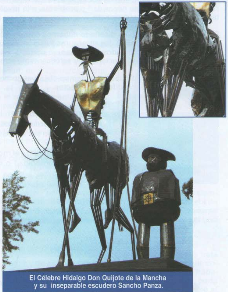
El Célebre Hidalgo Don Quijote de la Mancha y su inseparable escudero Sancho Panza.

Se fabricó en un tiempo récord de 22 días. Entre las técnicas utilizadas están la forja, soldadura eléctrica y oxicorte. También fue necesario la construcción de una réplica del martillo a pedal que se mostró en el 3er Seminario Internacional de Herrería .