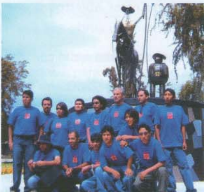
El Equipo de la Escuela Taller, responsables del proyecto encargado por la Municipalidad de Arequipa

Cabe destacar un especial reconocimiento al talento de los alumnos de la Escuela Taller que, con sólo 7 meses en el campo de la Herrería y Forja, lograron un brillante trabajo.