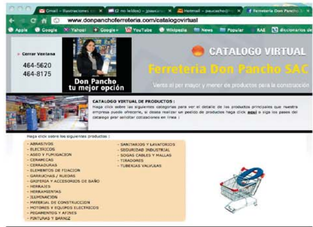
Una página web te permite contar con un catálogo en línea.

El Internet, día a día, se está convirtiendo en un medio de comunicación muy utilizado. La mayoría de peruanos lo usa para contactarse con el mundo a través del correo electrónico, páginas Web, redes sociales, como Facebook y Twitter, y servicios de mensajería instantánea o chats, como el Messenger u otros. Sin embargo, según Google Latinoamérica, los peruanos también empleamos la Red para buscar información. Quizás en muchos casos las personas usen más Internet que las guías telefónicas.