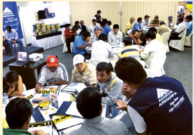
Conversatorio para maestros de obra en Chiclayo.