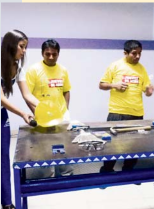
En Chepen se desarrolló el evento Jueves del Acero, donde se habló sobre los beneficios de los estribos corrugados de Aceros Arequipa.

Las Jornadas de Carpintería Metálica, las charlas “Cómo Crecer en Mi Negocio”, el Seminario del Progreso y el Taller de Construcción fueron los primeros eventos de Aceros Arequipa con comerciantes, maestros y carpinteros metálicos.