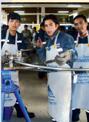
Jornada de Carpintería Metálica en Huaraz, donde estudiantes de metalmecánica demostraron sus habilidades creativas.