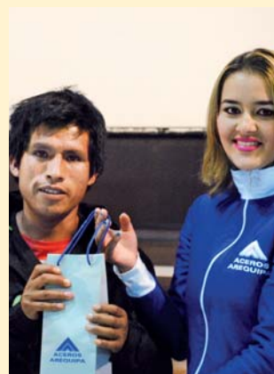
Capacitación “Como Crecer en mi Negocio” para nuestros clientes comerciantes de Cajamarca y Huancayo.